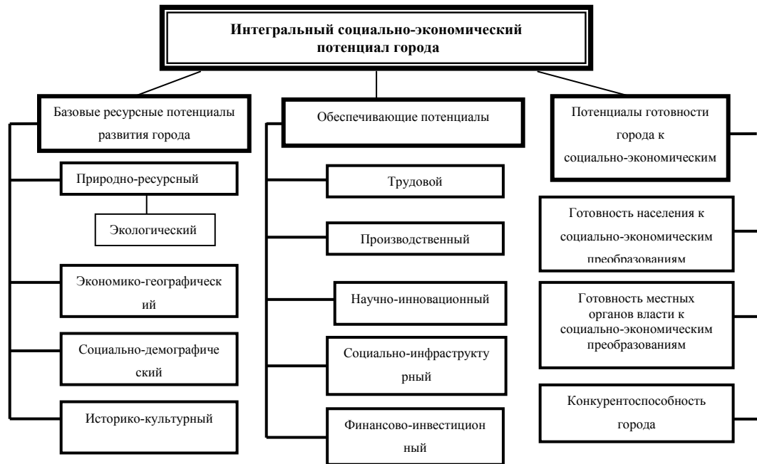
Рис. 2. Структура социально-экономического потенциала города

инвестиции (6); 8) экология (6). Внутри каждого блока рассчитывался средний балл. Для этого ранжированием по совокупности 11 городов-миллионеров определялось место, занимаемое городом по каждому показателю (1 место – 11 баллов, 11 место - 1 балл). Общая сумма баллов, набранная городом внутри каждого блока, делилась на количество показателей, которым представлен блок.