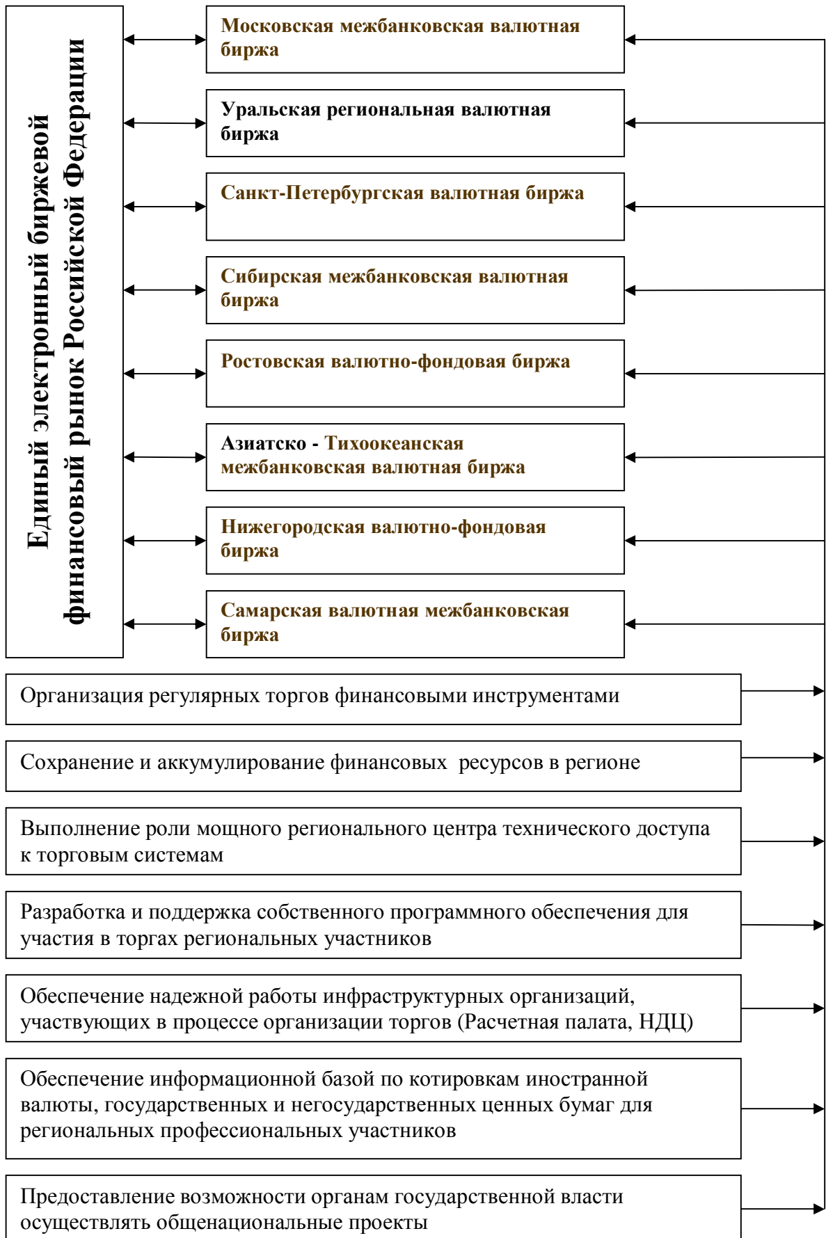
Рис. 1. Принципиальная схема участия региональных бирж в создании единого финансового рынка РФ